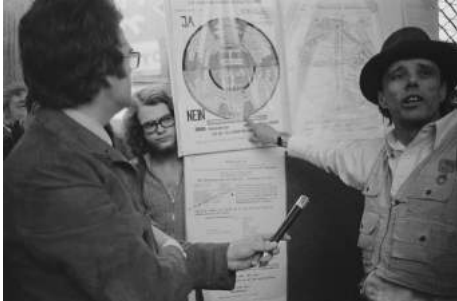
Joseph Beuys Eine Straßenaktion , 1971 © VG Bild-Kunst, Bonn 2021