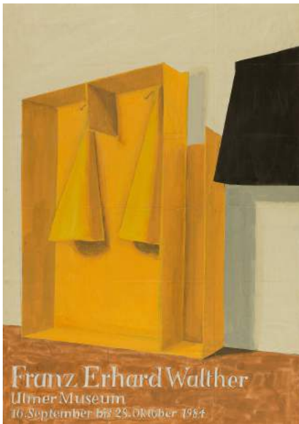
Franz Erhard Walther Plakatentwurf, 1984