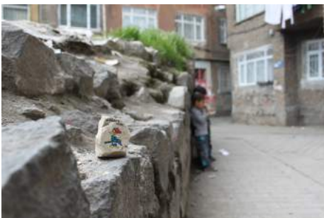
Ahmet Ögüt Stones to throw , 2011