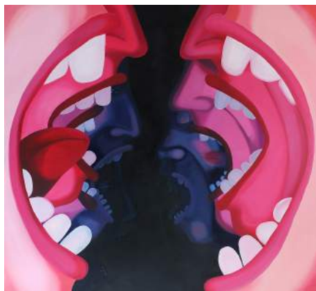
Karolina Jabłońska Screaming people , 2017, Courtesy of the artist, Tomasz Pasiak und Raster Gallery