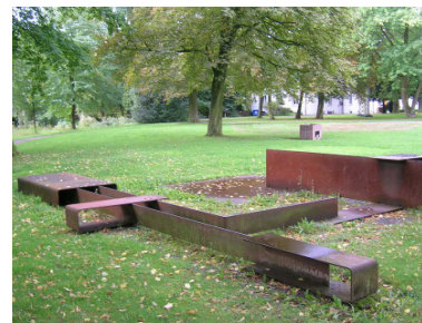
7 Günter Wolf, „Raumklammer Nr. 8“, 1994 Stahl, 8-teilig 80 x 540 x 860 cm

Wie im Titel angedeutet, umschließt Günter Wolfs Skulptur Raum. Einzelne Stahlplatten und -bänder sind zu Modulen verschweißt, die wiederum ein größeres Ganzes bilden. Die einzelnen Elemente umfassen Raum, schließen ihn ein, durchstoßen ihn oder bilden Abgrenzungen. Der Betrachter bewegt sich durch das Gebilde wie durch ein spannungsreiches Feld, durch diverse ein- und ausgrenzende Teilstücke geformt. Im Wechsel von Ansichten, Aufsichten und Durchblicken erlebt der Betrachter den Raum segmentiert und aus verschiedenen, gelenkten Perspektiven.