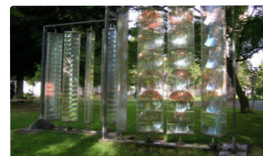
9 Adolf Luther, „Integration“, 1985 Sphärisches Hohlspiegelobjekt 4 Stelen mit runden Hohlspiegeln je 306 x 51,5 x 14,5 cm 4 Stelen mit streifenförmigen Hohlspiegeln je 283 x 40 x 13 cm Metallgestell

Der Betrachter darf nicht nur Adolf Luthers Skulptur anfassen, er ist sogar ausdrücklich dazu angehalten. Der Titel ist hier auch tatsächlich Programm. Aktiv wird man Teil des Ganzen. Durch Drehung der einzelnen Reihen von Hohlspiegeln und Prismen aus Plexiglas entstehen immer wieder neue Spiegelungen und Brechungen des Lichts. Diese Beschäftigung mit der physikalischen Beschaffenheit des Lichts zieht sich durch das Schaffen Adolf Luthers und findet sich hier im Park in besonders großem Format. Ohne das Licht zu mystifizieren, gelingt es Luther seine Zusammensetzung durch das Auffächern der einzelnen farblichen Elemente transparent zu machen.