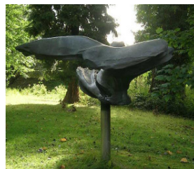
8 Francesco Somaini, „Forma alata (geflügelte Form)“, 1958/1965 Bronze ca. 70 x 190 cm

Wie flüssiges Metall, das soeben erst erstarrt ist, klebt der obere Teil von Somainis Skulptur auf einer Stehle. Als habe der Bildhauer gerade noch den heißen Werkstoff schwungvoll gerührt und in der Bewegung zum Erkalten gebracht. Somaini nimmt dem Metall seine Schwere und Starrheit und verleiht ihm, wie im Titel angedeutet, Flügel.