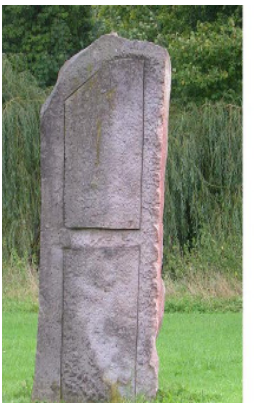
Pinuccio Sciola: *1942 in San Seperate/ Sardinien/ Italien, lebt und arbeitet in San Seperate

Monolithisch ragt der Stein aus der Wiese. An den groben Kanten sieht man noch die Spuren der Loslösung aus einem größeren Felsen. In die Vorder- und Rückseite des Steins sind jeweils zwei mehr oder weniger regelmäßige Vierecke eingehauen, die sich zum Teil aus dem Stein zu erheben bzw. auf der anderen Seite in ihm zu verschwinden scheinen; geradeso als seien die Flächen innerhalb der Einkerbungen nicht starr sondern frei beweglich, als sei es ein Leichtes für den Besucher die abgesetzten Flächen durch den umgebenden Stein wie ein Fenster aus seinem Rahmen zu schieben. In der singulären Präsenz der Steintür im Schlossgarten ergeben sich zudem Assoziationen zu fantastischen Erzählungen wie zum Beispiel Alice im Wunderland. Vielleicht ein Eingang in eine andere Welt oder ein Ausgang aus ihr heraus?