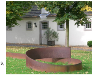
3 Lutz Fritsch, „Maßlos (Vertikal ROT)“, 1991 Stahlrundrohr, Lackfarbe Höhe: 295 cm, Durchmesser: 5 cm

Lutz Fritschs Skulptur erinnert an einen Vermessungsstab, eine Markierung im Raum. Wie willkürlich auf den Platz vor dem Schloss gesetzt, bricht dieses „Raum-Zeichen“ mit der Symmetrie der Hofanlage. Die rote Farbe des Stabs ist grell, aggressiv und erregt Aufmerksamkeit. Hinter dem Rot verschwindet allerdings die dreidimensionale Form. Es bleibt ein einfacher, roter Strich in der Landschaft. Die Intensität der Farbe schafft neue Verhältnisse, bildet einen alternativen, farblichen Mittelpunkt zum symmetrischen Drumherum der Schlossanlage. An ihm kann der Besucher sich orientieren, einen Bezug zum umgebenden Raum herstellen. Der Stab akzentuiert und strukturiert die räumliche Situation neu, ohne jedoch in den Platz einzugreifen. Fritschs Skulptur ist eine ruhige, stille Intervention, die gegebene Strukturen aufbricht und in Frage stellt, ohne sie jedoch dabei zu zerstören. Im Gegenteil betont sie dadurch, dass der Besucher eine Position im Verhältnis zu ihr einnehmen und dabei über den Platz reflektieren muss, die besonderen Eigenschaften der Raumsituation.