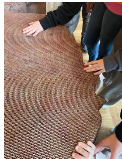
Andrea Wolfensberger, Between Yes and No. Yes I do! , 2022 (Detail)