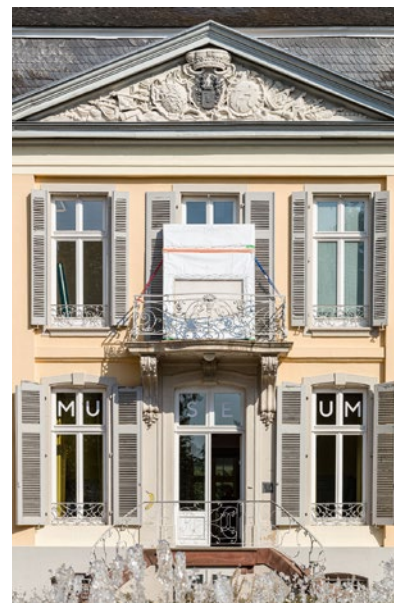
© Johanna von Monkiewitsch